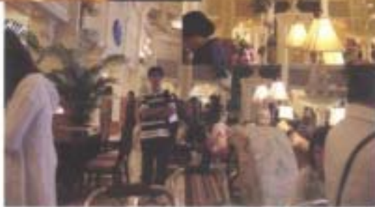
↑この写真に31に野村先生がっ。