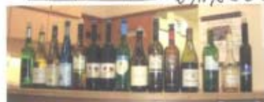
＜全部で15種類ありました＞

和やかな雰囲気の中、皆様はワインを堪能していただけたようでした。患者様と色々なお話をしながら、楽しく交流を持てたことを大変嬉しく思っております。たくさんのご参加、本当に