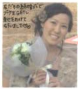
私たちのあふれる笑顔が アツクGETし 幸せをわけて もらいました。